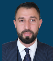
Ministria e Administrimit të Pushtetit Lokal