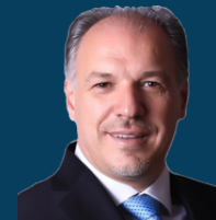
Ministria e Zhvillimit Rajonal