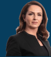
Ministria e Arsimit, Shkencës, Teknologjisë dhe Inovacionit