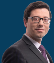
Ministria e Financave, Punës dhe Transfereve