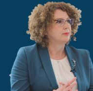
Ministria e Industrisë, Ndërmarrësisë dhe Tregtisë