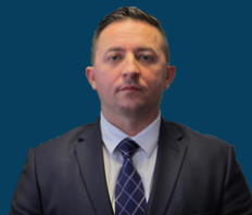
Ministria e Mbrojtjes