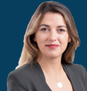
Ministria e Drejtësisë