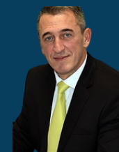
Ministria për Komunitete dhe Kthim