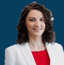
Ministria e Ekonomisë