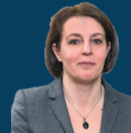
Ministra e Punëve të Jashtme dhe Diasporës