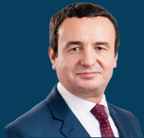
Zyra e Kryeministrit