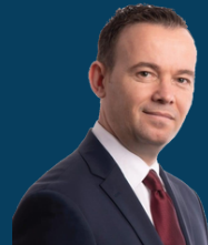
Ministria e Bujqësisë, Pylltarisë dhe Zhvillimit Rural