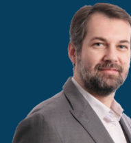
Ministria e Kulturës, Rinisë dhe Sportit