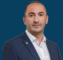
Ministria e Mjedisit, Planifikimit Hapësinor dhe Infrastrukturës