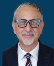
Ministria e Shëndetësisë