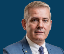
Ministria e Punëve të Brendshme